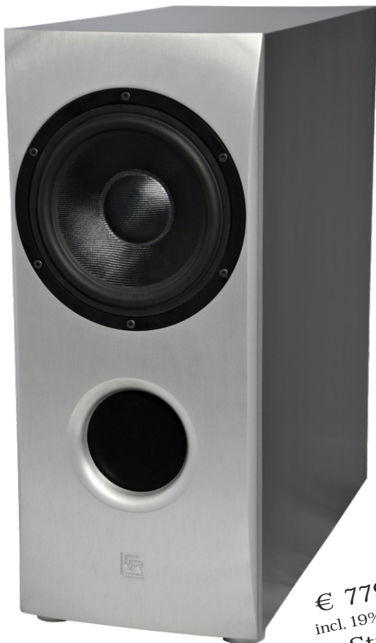
Natrox Lautsprecherblende Aluminium-Natur Gehäuse Platindrau

€ 779,00 incl. 19% MwSt. Stück (Standardvariante)