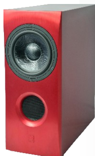
Natrox Blende Bordeaux Gehäuse Weinrot